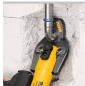
REMS pressring 45° (PR-2B) Patent EP 2 774 725