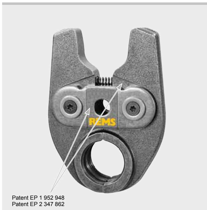
Patent EP 1 952 948 Patent EP 2 347 862

Med denne sporbarhed opfylder REMS anbefalingerne i EU norm EN 1775:2007 ved installation af pressfittings til gas.