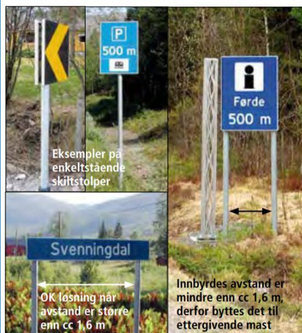
Fig. 79 Eksempler på skiltoppsett

Generelt skal alt oppsettsutstyr, være ettergivende dersom det er plassert innenfor sikkerhetssonen. Sikkerhetssonen beregnes i henhold til kap 2.2.1 og 2.2.2 i Håndbok N101 Rekkverk.