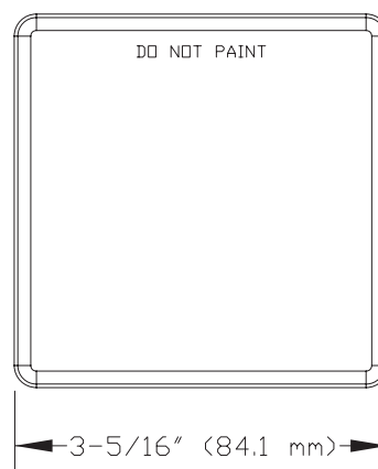
Figur 2: Fyrkantlock 15394