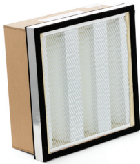
HEPA FILTER 590 46 08-01