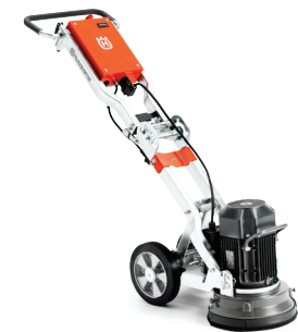
HUSQVARNA PG 280 967 27 82-01