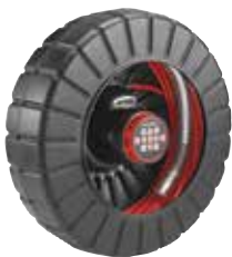
rM200 D2A Katalog Nr. 47553

Konstruerad att användas med CS6 eller CS65 Digital Monitor som dockas på vindan, även kompatibel med alla övriga SeeSnake monitorer.