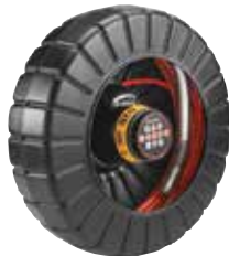
rM200 D2B Katalog Nr. 47543