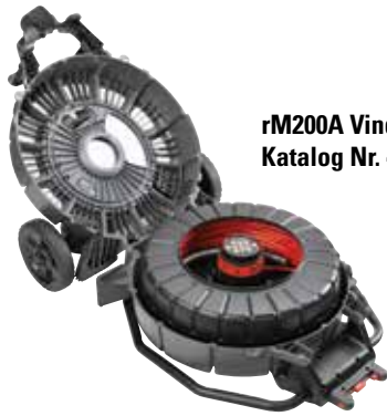
rM200A Vinda Katalog Nr. 42353