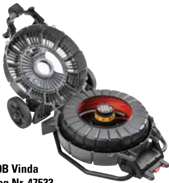
rM200B Vinda Katalog Nr. 47533