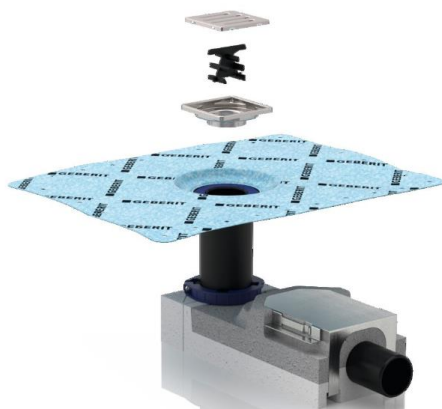
Fig. 3 Geberit gulvsluk for rist – Slukrist Standard