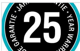
25 ÅRS GARANTI