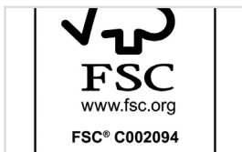
FSC® 100 %-SERTIFISERT TRE