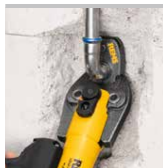
REMS pressring 45° (PR-2B) Patent EP 2 774 725