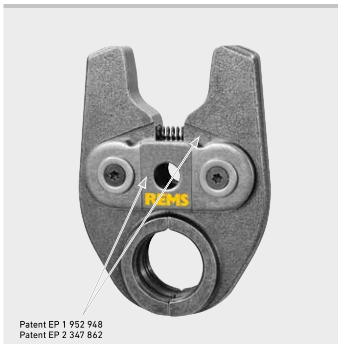
Patent EP 1 952 948 Patent EP 2 347 862

Med denne sporbarhed opfylder REMS anbefalingerne i EU norm EN 1775:2007 ved installation af pressfittings til gas.