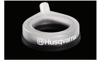
SLURRY RINGS WSR 593 56 30-03