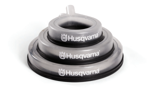
SLURRY RINGS WSR 593 96 39-02