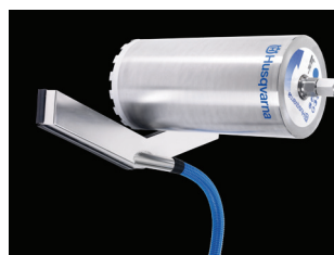
SLAMOPPSAMLER V-FORMET 531 07 46-22