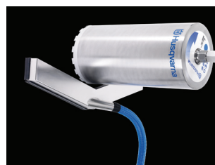
SLAMOPPSAMLER V-FORMET 531 28 00-07