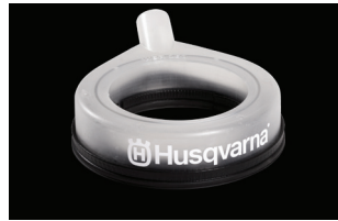
SLURRY RINGS WSR 593 56 30-05