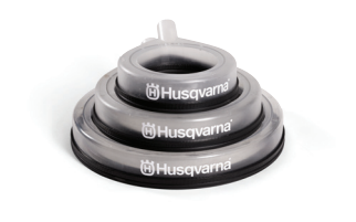
SLURRY RINGS WSR 593 96 39-01