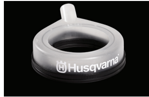
SLURRY RINGS WSR 593 56 30-01