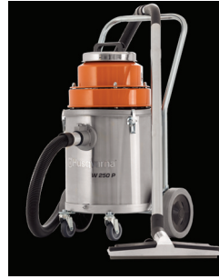
HUSQVARNA W 250 P 967 70 21-02