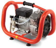
HUSQVARNA VP 200 544 92 90-01