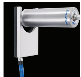
SLAMOPPSAMLER U-FORMET 531 28 03-29