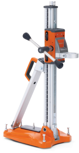
HUSQVARNA DS 150 966 82 72-01