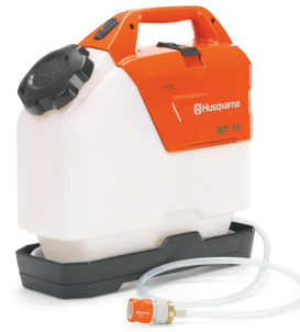
WT 15 966 70 83-02