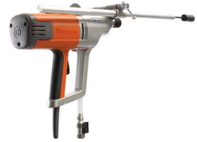
TELESKOPISK STARTHJELPSANRODNING 522 92 95-01