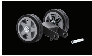
HJULBASE DS 250 / 150 541 40 50-89