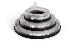
SLURRY RINGS WSR 593 96 39-04