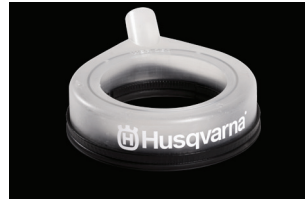
SLURRY RINGS WSR 593 56 30-02