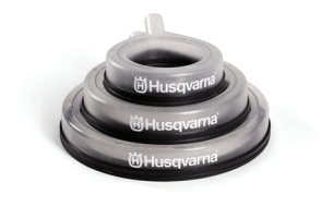
SLURRY RINGS WSR 593 96 39-06