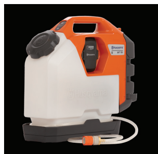
HUSQVARNA WT 15 599 58 24-05