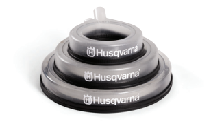
SLURRY RINGS WSR 593 96 39-03