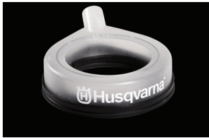
SLURRY RINGS WSR 593 56 30-04