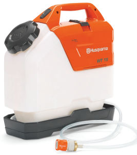
WT 15 966 70 83-01