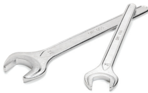
BORMOTORNØKLER 531 14 09-51