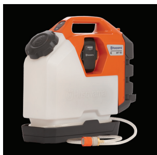
HUSQVARNA WT 15 599 58 23-02