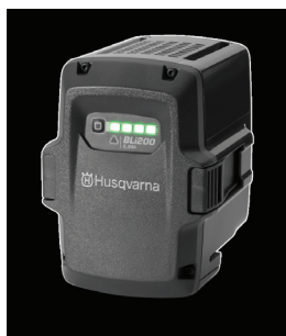
.HUSQVARNA CONSTRUCTION BATTERI BLI200 967 96 41-01