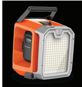
HUSQVARNA WL 81 970 58 49-01