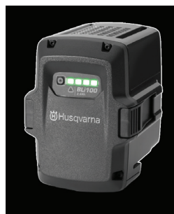
.HUSQVARNA CONSTRUCTION BATTERI BLI100 967 96 39-01