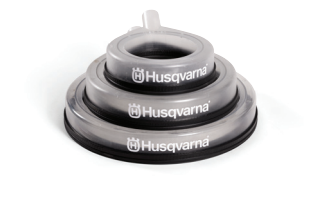
SLURRY RINGS WSR 593 96 39-05