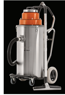
HUSQVARNA W 70 P 967 66 47-04