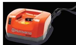
HUSQVARNA LADER QC500 967 96 50-01