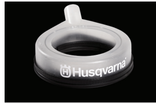
SLURRY RINGS WSR 593 56 30-06