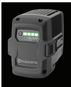
.HUSQVARNA CONSTRUCTION BATTERI BLI300 967 96 43-01