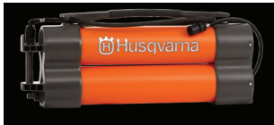
HUSQVARNA WT2GO 598 74 24-01