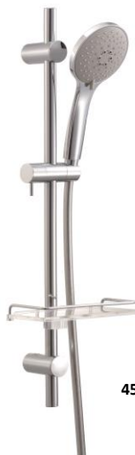
4501628 Uni dusjsluger pvc