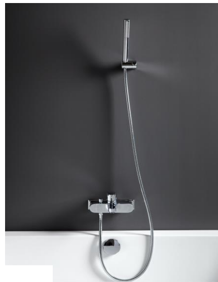
4501629 Uni dusjsluger S/S 4501635 Uni veggbrakett