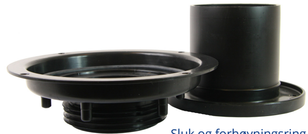
Sluk og forhøyningsring UTEN anboring

Montering av Pili- forhøyningsring uten anboring, utføres på følgende måte: