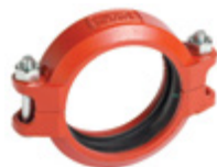
1 – 8"/DN25 – DN200