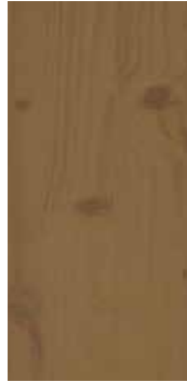
Furu Jotunheimen nobb 60082647 Brunpigmentert