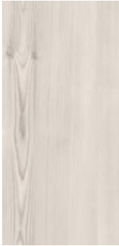
Furu Hvaler nobb 60082645 Hvitpigmentert