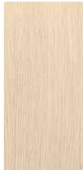
Eik Hvaler nobb 60082653 Hvitpigmentert