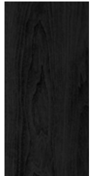
Eik Saltfjellet nobb 60082659 Sortpigmentert