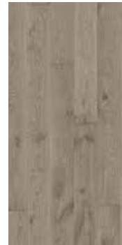
Eik Varanger nobb 60082657 Gråpigmentert