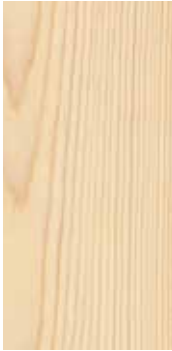
Furu Rondane nobb 60082640 Klarlakk