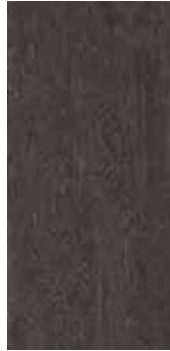
Furu Saltfjellet nobb 60082650 Sortpigmentert