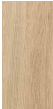
Eik Rondane nobb 60082652 klarlakk

5 tidsriktige og naturlige farger. For prosjekt leverer vi presis den overflaten og fargetone som ønskes.