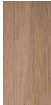
Eik Jotunheimen nobb 60082655 Brunpigmentert