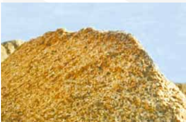
Fra vårt råvarelager (flis) på Gjøvik.

Hunton Vindtett blir produsert gjennom en miljøvennlig prosess hvor flis fra sagbruk males opp til en fin masse. Denne massen blir tilsatt store mengder vann før den presses sammen til en porøs trefiberplate. Fibrene bindes sammen med lignin – treets naturlige limstoff. Platen er et rent treprodukt impregnert med asfalt for økt fuktmotstand. Impregneringen gjør Hunton Vindtett aldringsbestandig og reduserer sopp, råte og angrep av skadedyr.