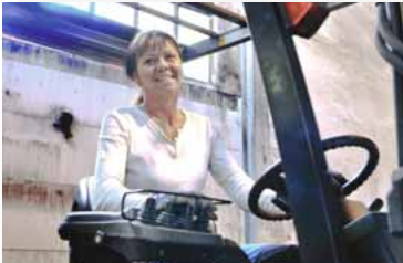
Fra produksjon, her blir trefiberplatene laget.

Hunton Vindtett produseres i Norge, ved vår fabrikk på Gjøvik. Det værharde klima i Norge gjør at platen må være ekstra motstandsdyktig mot vær og vind. Hunton Vindtett motstår surt, fuktig men også varmt vær og er derfor populær over hele verden. I underkant av 50% av alle asfaltplater som vi produserer blir eksportert til utlandet.