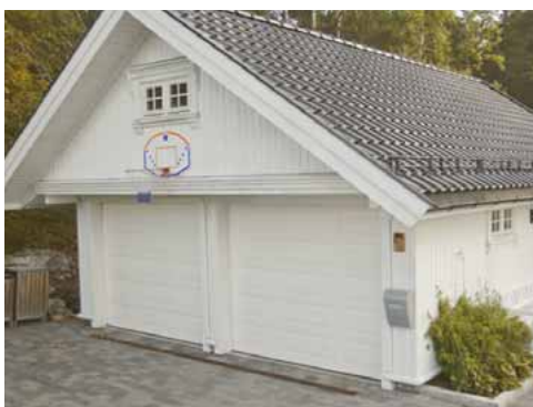
Ønsker du en lun garasje kan det være lurt å benytte Hunton Vindtett plater.