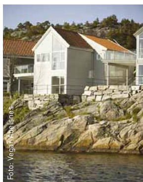
Hytter fra prosjektet Furuholmen har benyttet Hunton Vindtett 12mm.