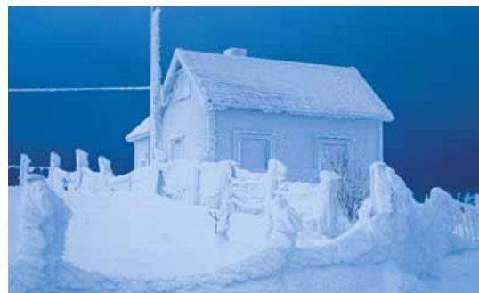
Med Hunton Vindtett vil du ha det behagelig inne selv om det er surt og kaldt ute.