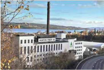
Huntons fabrikk på Gjøvik.