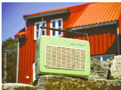
Med Hunton Vindtett plater kan du omgjøre sommerboligen til en helårsbolig.