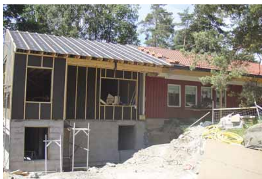
Tilbygget til Son Naturbarnehage begynner å ta form. Hunton Vindtett sørger for at bygget er tett.