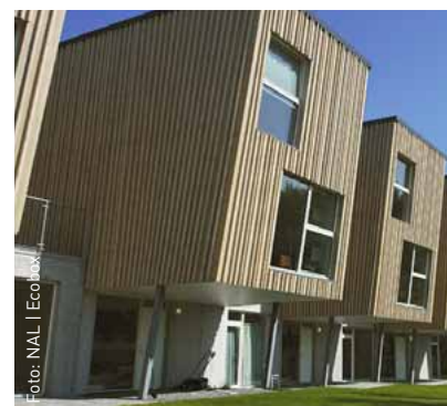
Norwegian Wood-prosjektet Marilunden i Stavanger utarbeidet av EderBiesel arkitekter, Rogaland prosjektering og utbygger Base Property. Prosjektet er bygd med 18mm Hunton Vindtett.