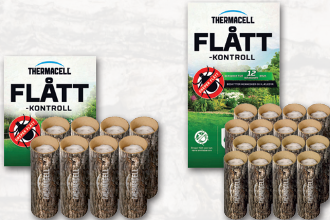
Thermacell Flåttkontroll 8 ruller: dekker 340m2