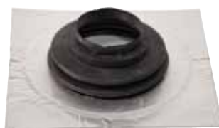
Rørmansjett, selvklebende butylkrage