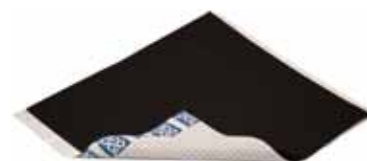
Universal Rørmansjett for utstansing