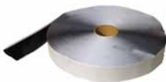
Icopal Butyl Tape, Dobbeltklebende