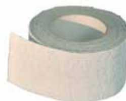
Icoflex PE Butylbånd, selvklebende