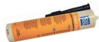
Icopal fugemasse Butyl