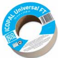
Icopal Universaltape FT