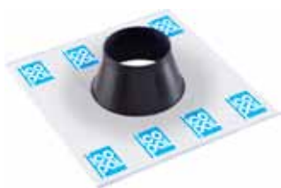
Rørmansjett, selvklebende tapekrage