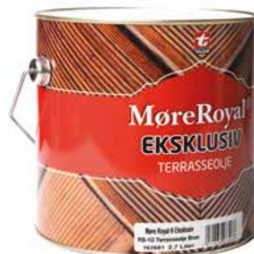
MøreRoyal® EKSKLUSIV TERRASSEOLJE

NOBB 45561301 brun NOBB 45561316 gul NOBB 49432740 grå NOBB 50822077 setersvart NOBB 45100561 klar