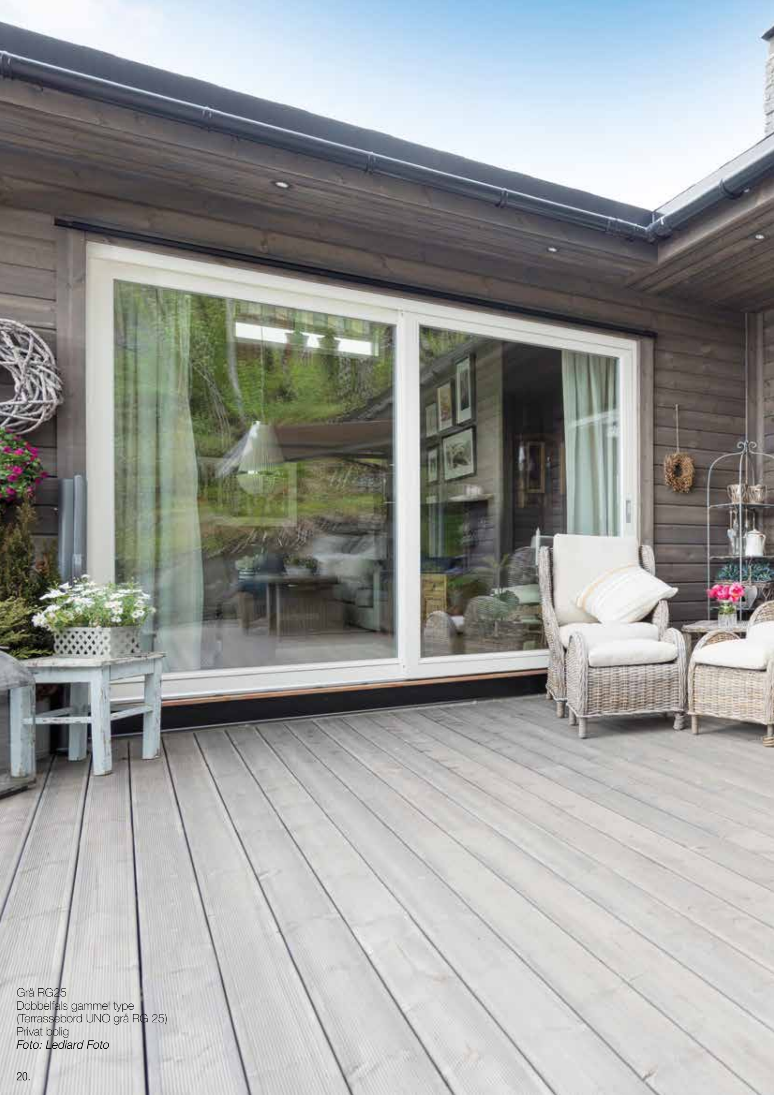
Grå RG25 Dobbelfals gammel type (Terrassebord UNO grå RG 25) Privat bolig