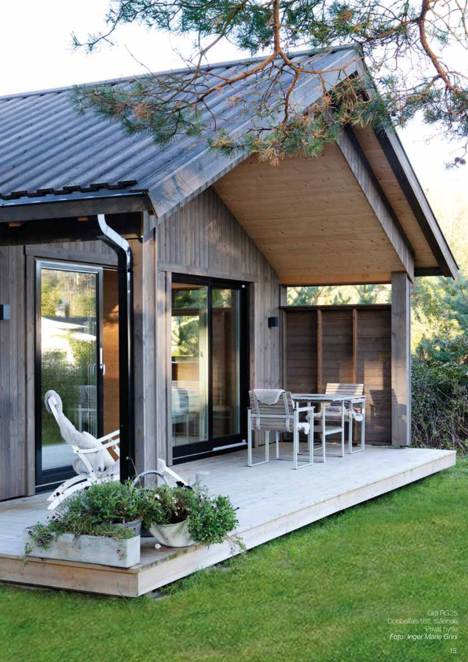
Grå RG25 Dobbelfals tett, stående Privat hytte