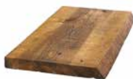
Uten endepløyning. Varierende bredde, en rett kant. Håndskavet.

Villmarkskledning er fortsatt et populært kledningsvalg i noen byggestiler, og vi leverer både i liggende og stående utgave.