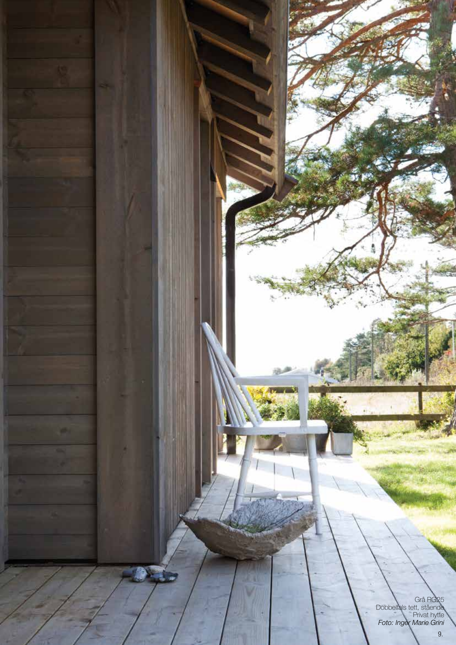
Grå RG25 Dobbeltfals tett, stående Privat hytte