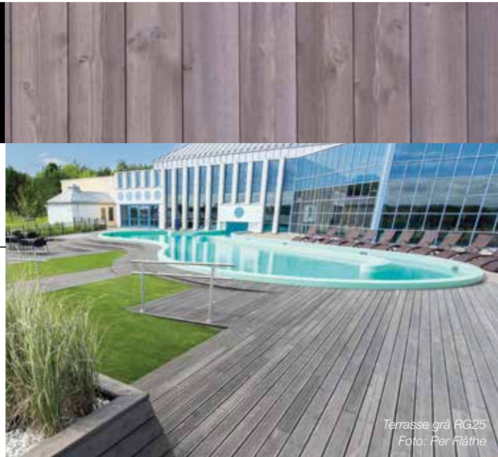
Terrasse grå RG25

MøreRoyal® terrassebord leveres i brun og grå i 5 ulike dimensjoner, og både som vendbar DUO med en glatt og en rillet side (brun) og som UNO med rill (grå).