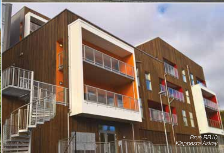
Brun RB10 Kleppesto Askøy