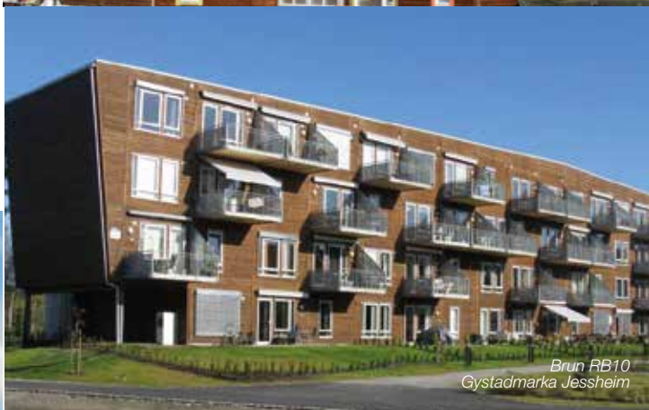
Brun RB10 Gystadmarka Jessheim