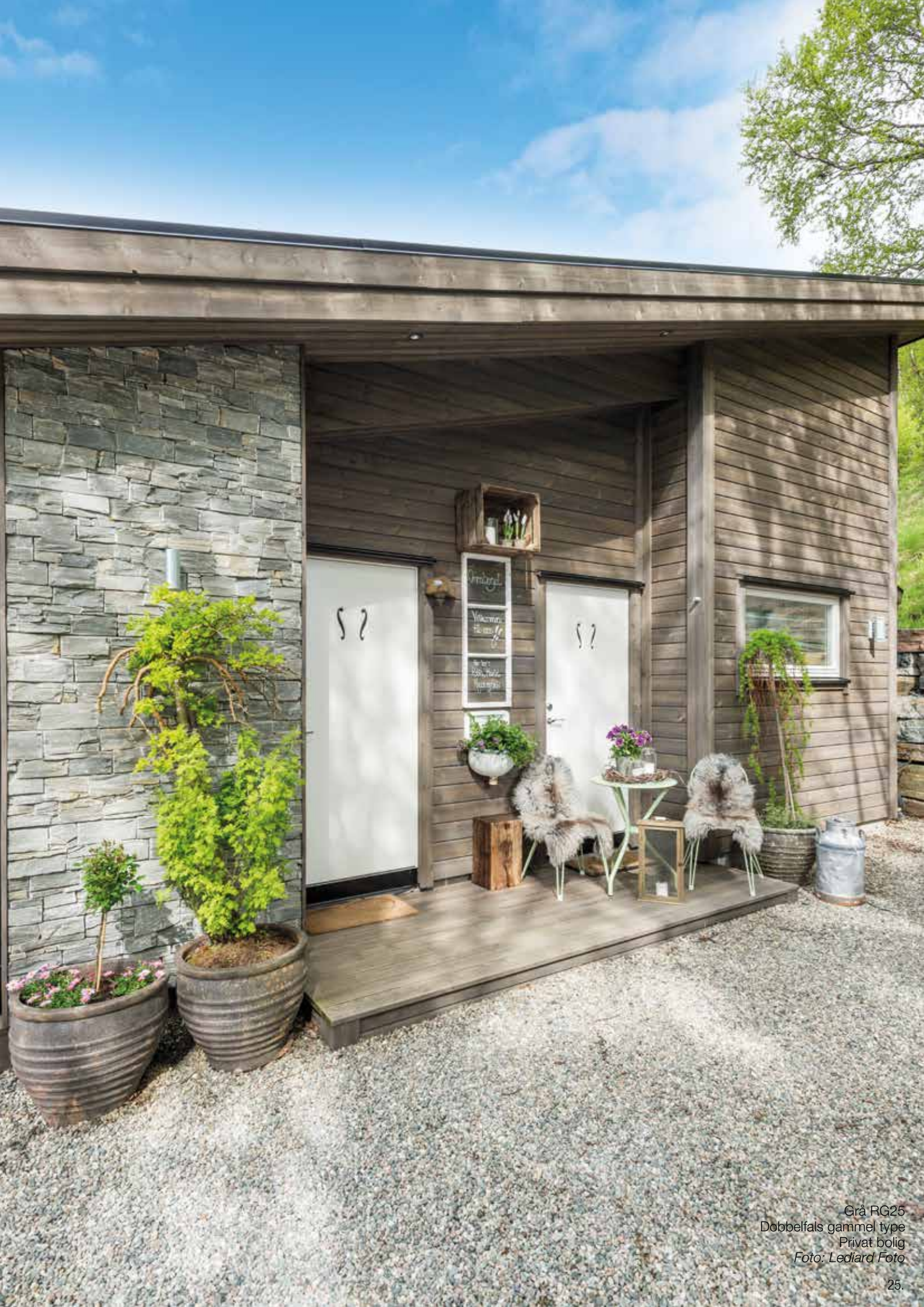
Grå RG25 Dobbelfals gammel type Privat bolig