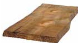
Uten endepløyning. Varierende bredde. Håndskavet. Underligger: dim 19x173