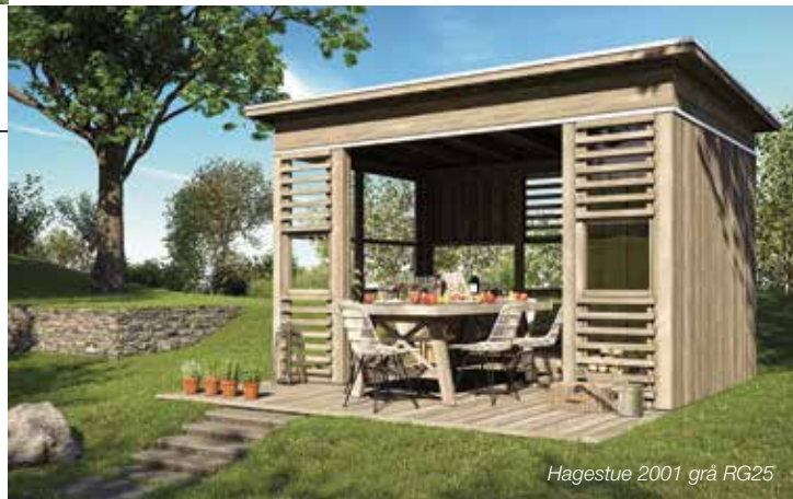
Hagestue 2001 grå RG25

PlusConcept by NOA ByggDesign er en serie arkitektutviklede byggesett til hagen innen kategoriene hagestuer, multiboder og pergola. Byggene er fleksible med mange valgmuligheter, og du setter det enkelt opp selv på en dag. Komplette priser og ferdig behandlet - klart til bruk!