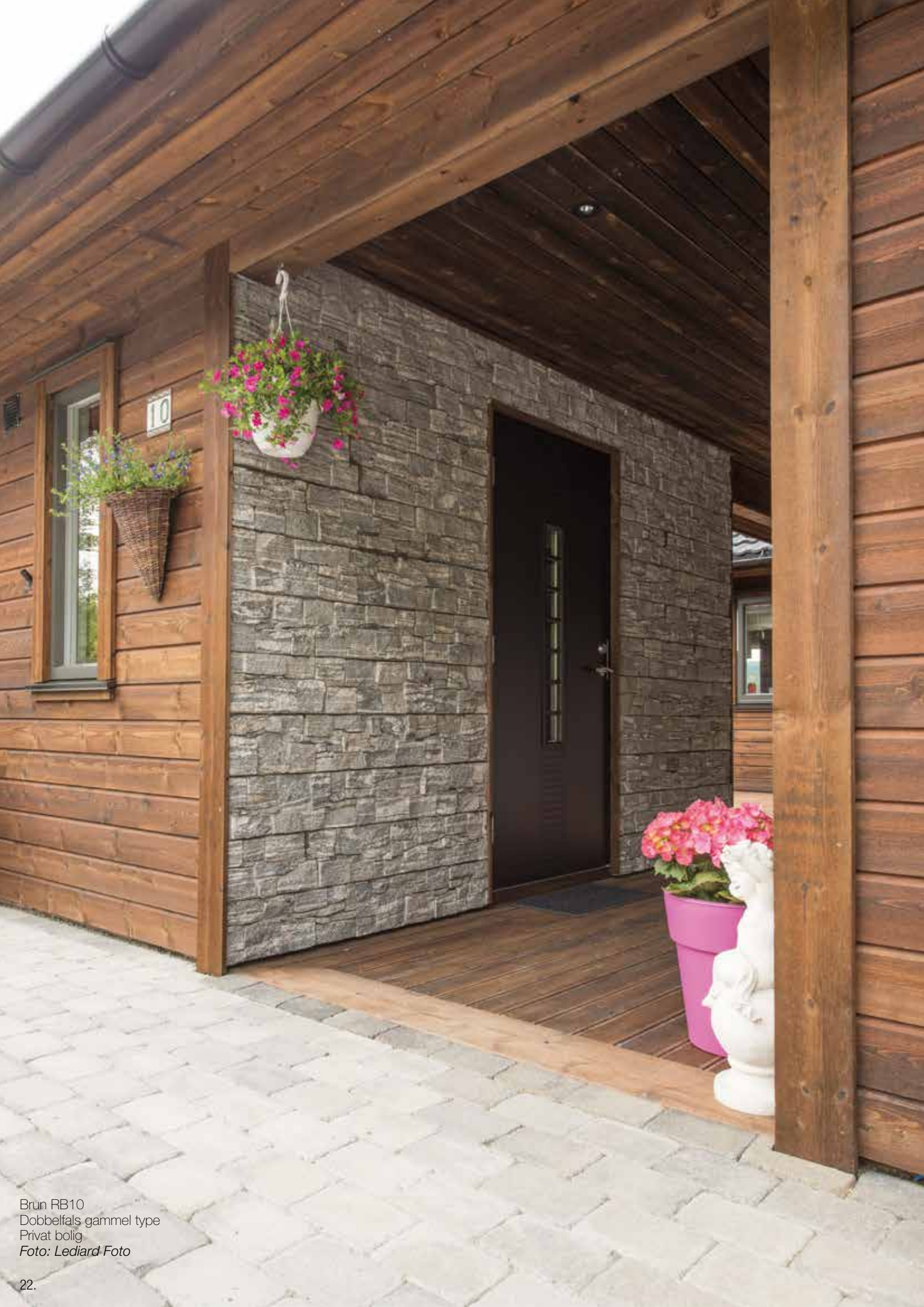
Brun RB10 Dobbelfals gammel type Privat bolig