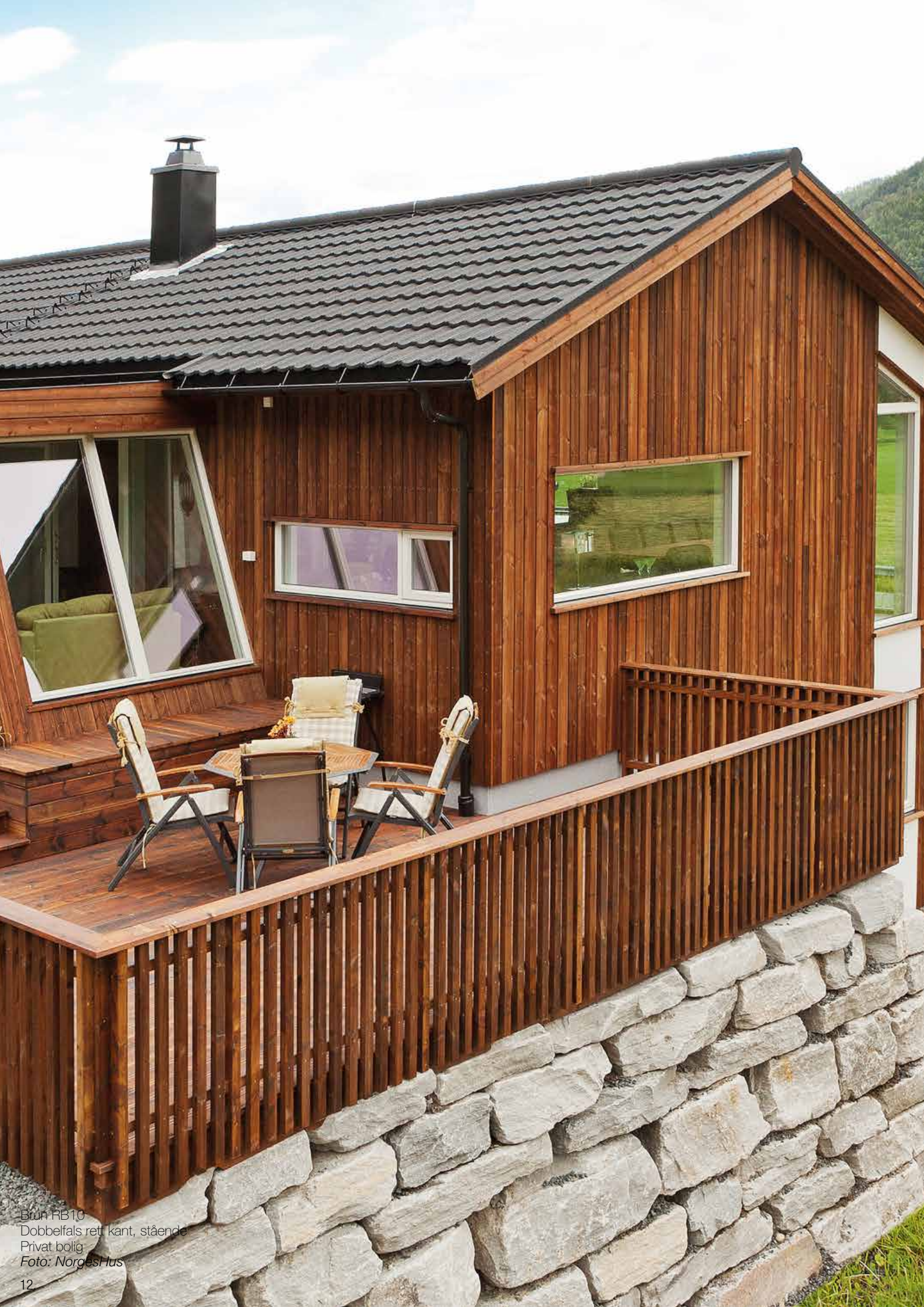
Brun RB10 Dobbelfals rett kant, stående Privat bolig