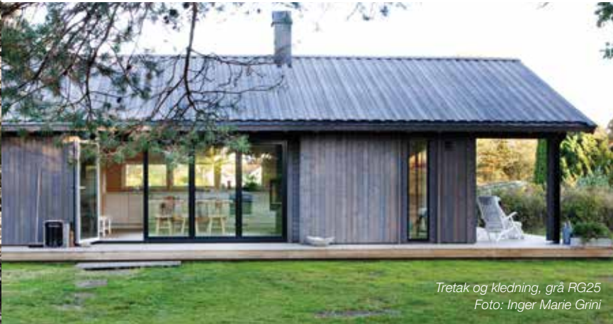
Tretak og kledning, grå RG25