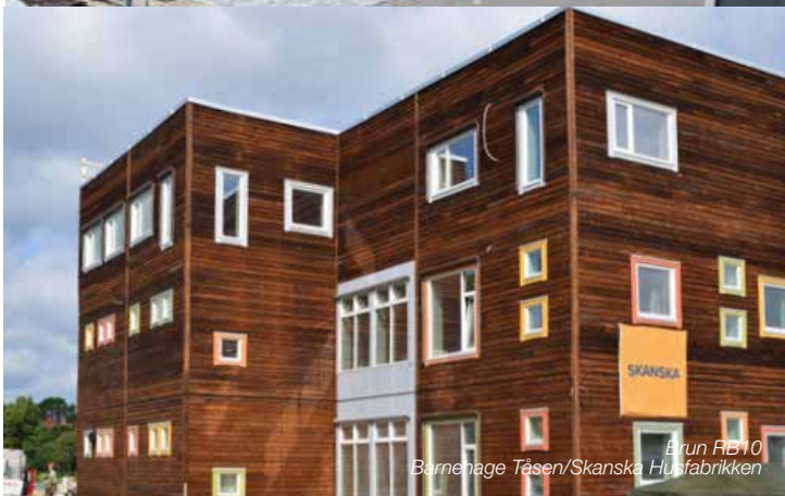
Brun RB10 Barneage Tåsen/Skanska Husfabrikken