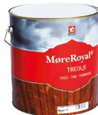
MøreRoyal® Treolje FOR VEGG OG TAK

PRODUKTER SÆRLIG TILPASSET MøreRoyal®- BEHANDLET TREVERK.