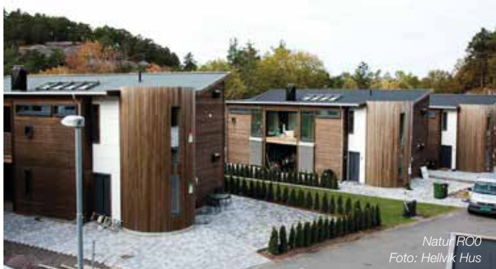
Natur RO0