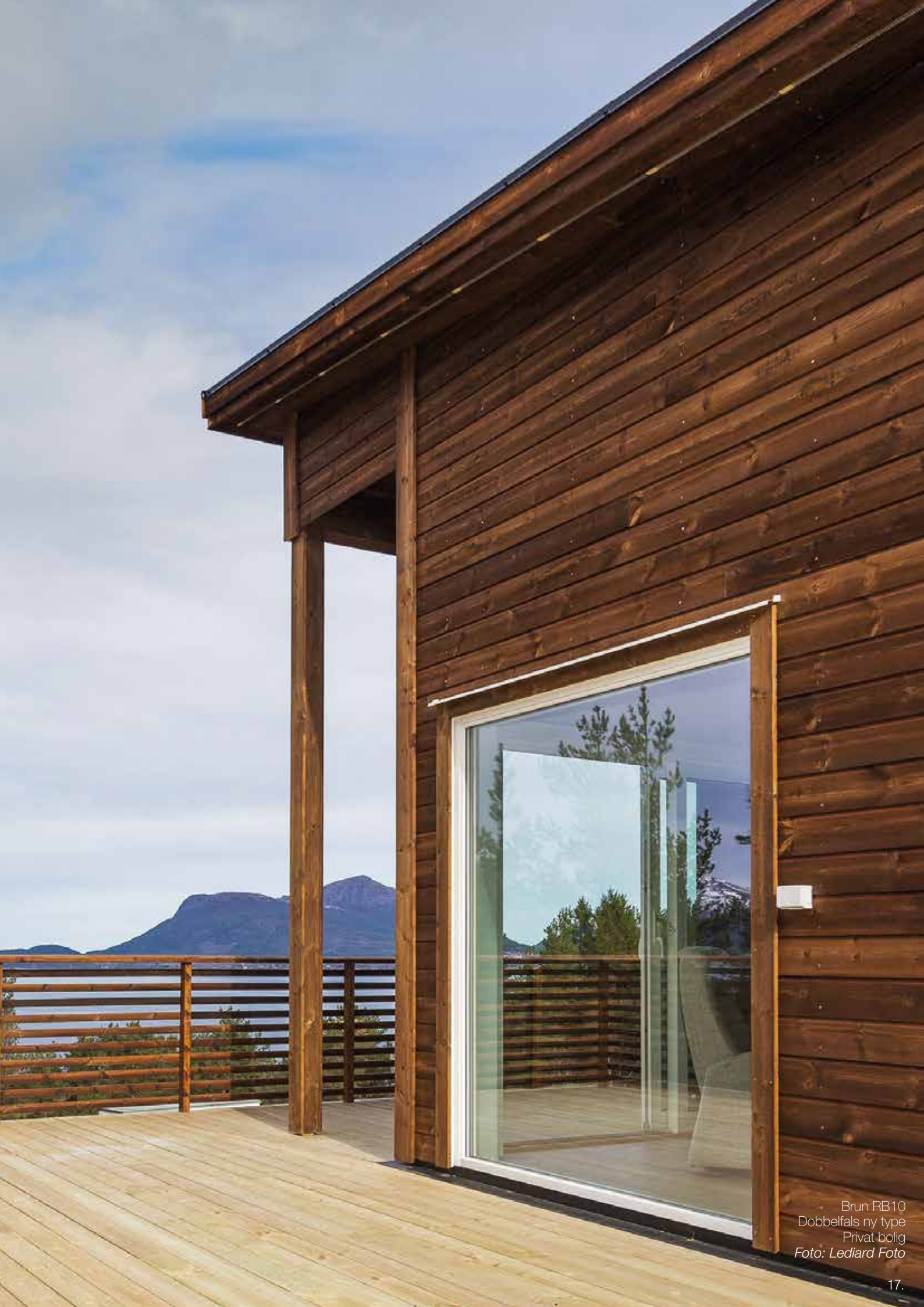
Brun RB10 Dobbelfals ny type Privat bolig