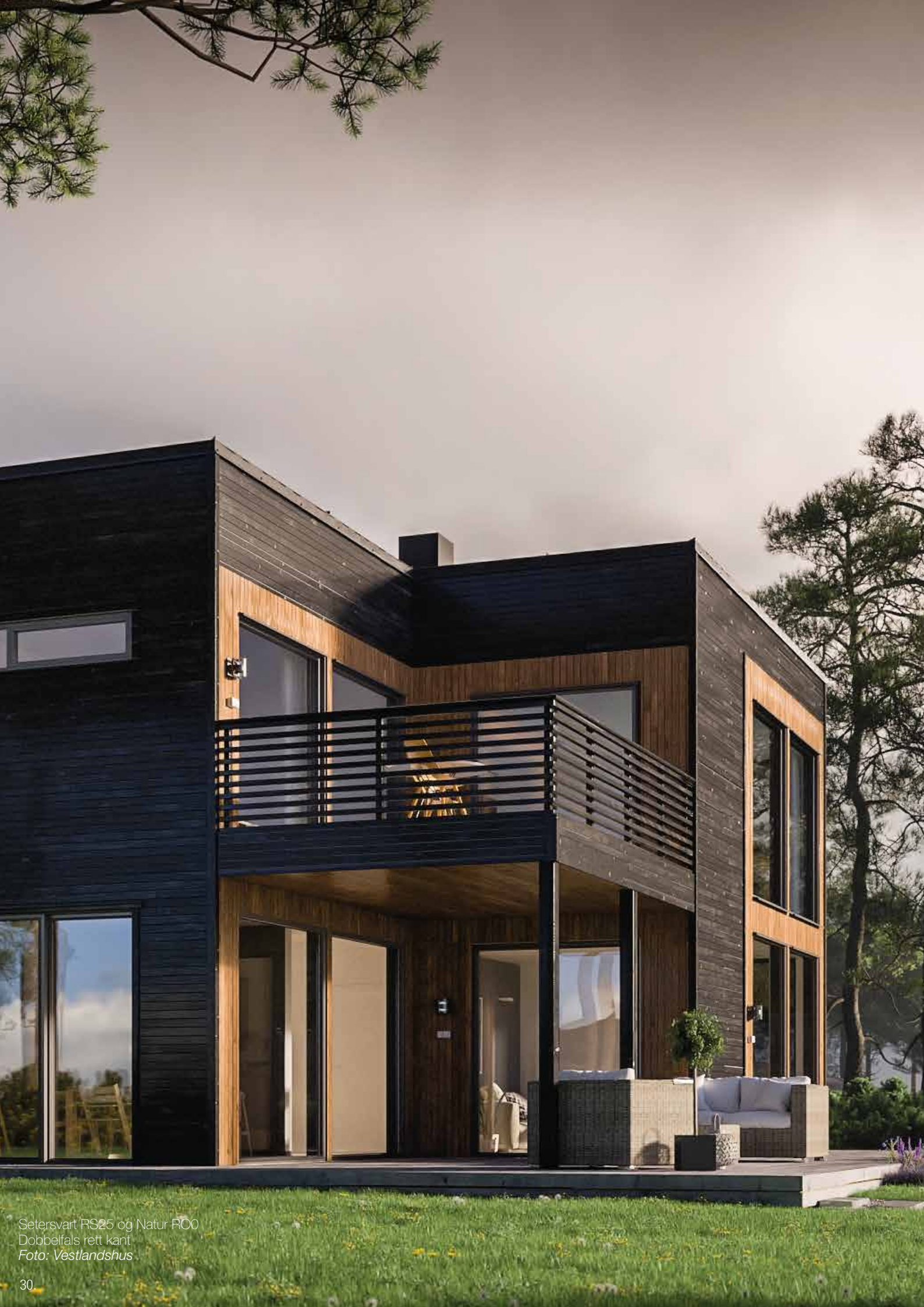
Setersvart RS25 og Natur R00 Dobbelfals rett kant