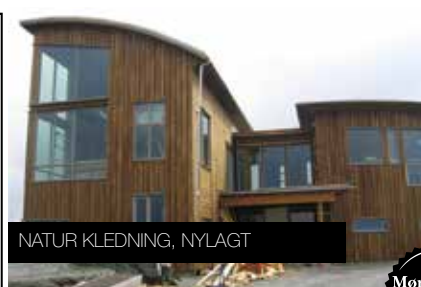
NATUR KLEDNING, NYLAGT

Treverket kan normalt stå mellom 10 og 20 år før første vedlikeholdende behandling, dersom man ikke vektlegger det kosmetiske.