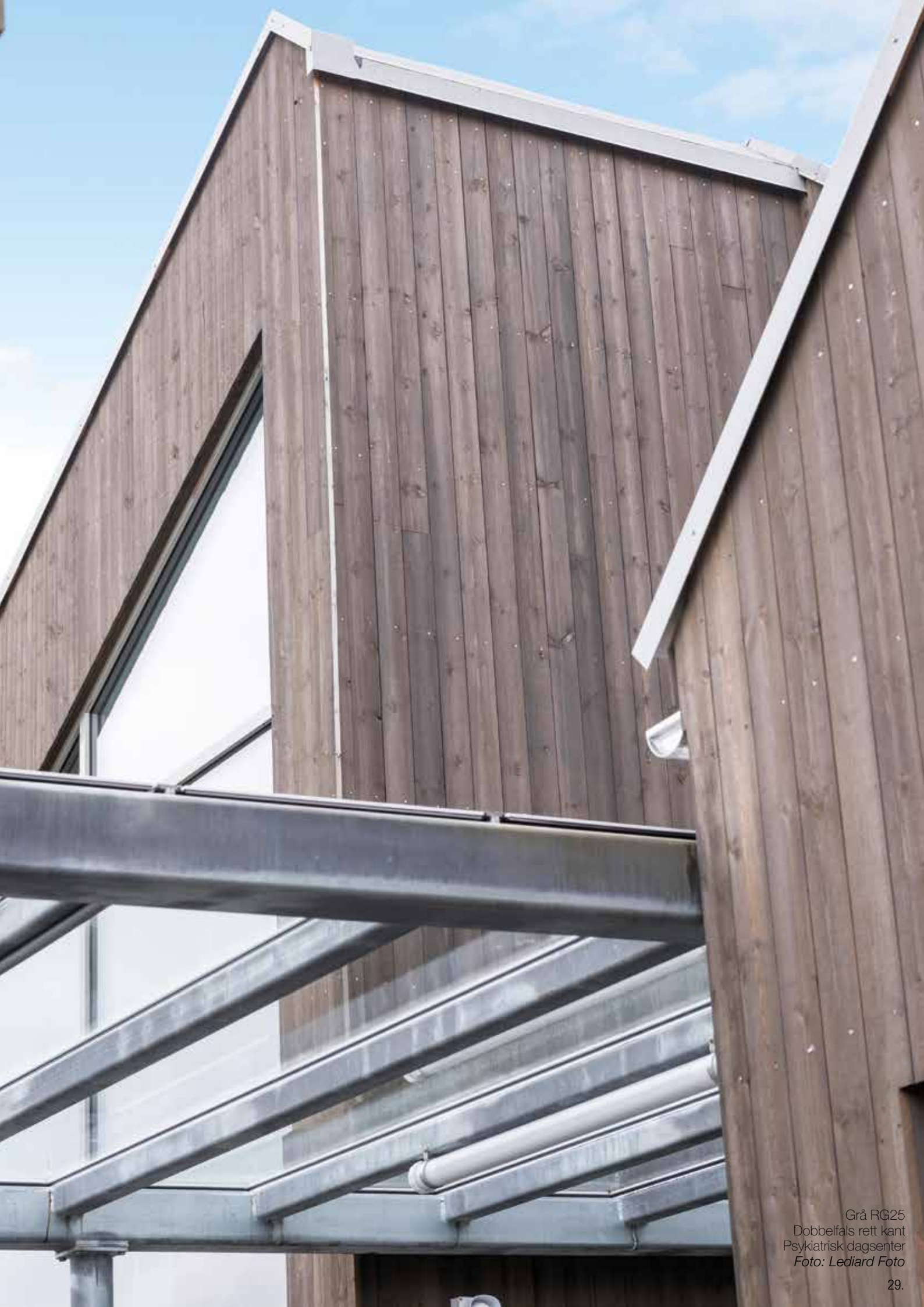
Grå RG25 Dobbelfals rett kant Psykiatrisk dagsenter