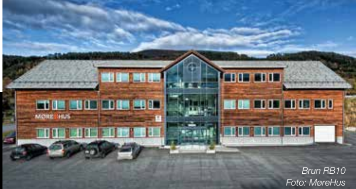
Brun RB10