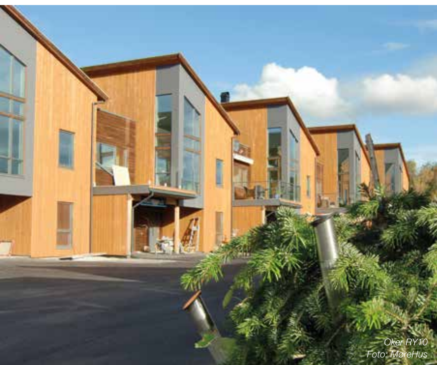
Oker RY10 Foto: MøreHus