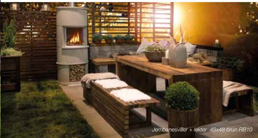
Jernbanesviller + lekter 48x48 brun RB10

MøreRoyal® produkter passer utmerket til bruk i uterommet med sin holdbarhet og råtegaranti. Lag utemøbler, bygg sti i hagen, snekre blomsterkasser, eller bruk de til omramming eller støttemurer. Se de ulike produktene på talgo.no