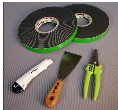
DAFA Flex 600 fugebånd

Du kan også se en montasjefilm på www.youtube.com/DAFADK