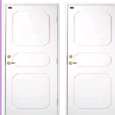
Klima SO 309