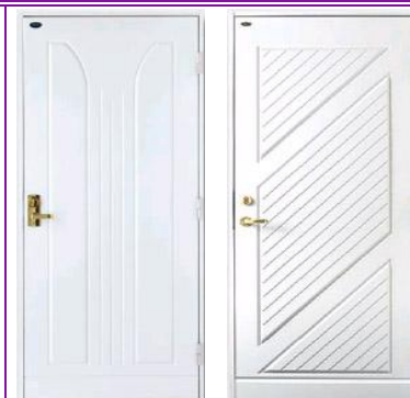
Klima HD 099