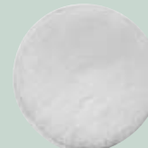
Lammeullhette 2 609 256 049