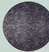
Poleringsfilt 2 609 256 054