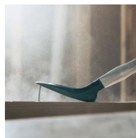
Bred og avrundet klyse med spikerutdrager gjør arbeidet komfortabelt og ergonomisk.