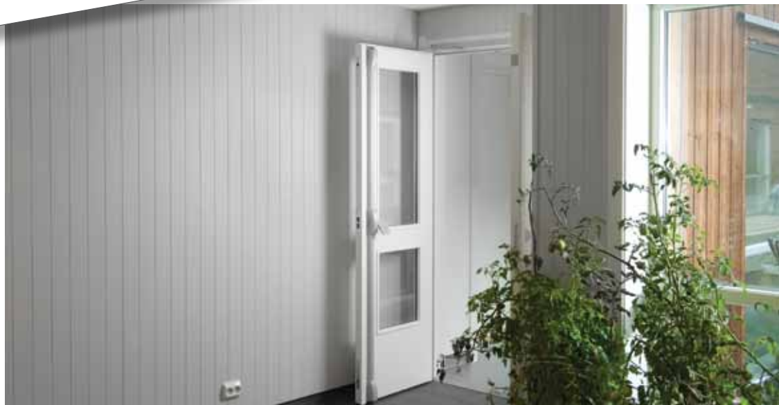
Bildene av Brannit er tatt på Blåkors Bo og Rehab senter