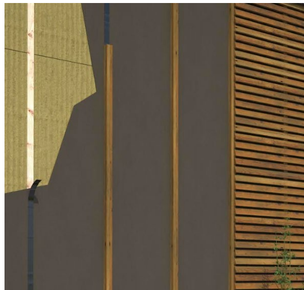
Fig. 1: BMI Norge AS

Icopal Ventex Vindsperre Premium kan ikke brukes som kombinert undertak og vindsperre.