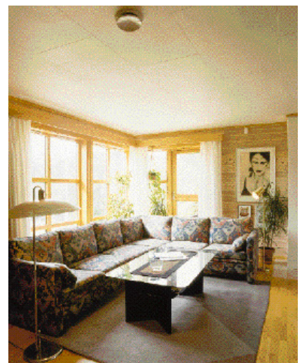
Arbor ferdigmalt himlingsplate