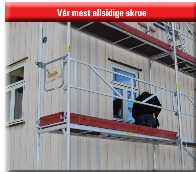
Vår mest allsidige skrue