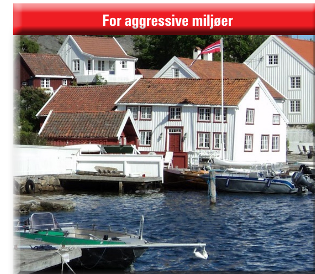
For aggressive miljøer