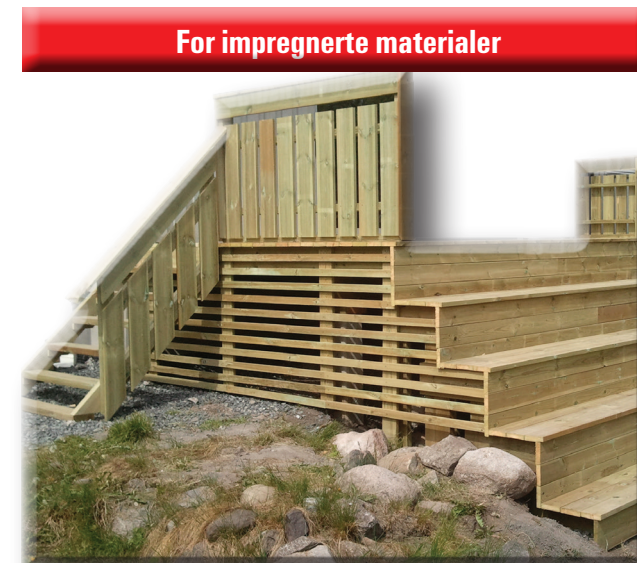
For impregnerte materialer