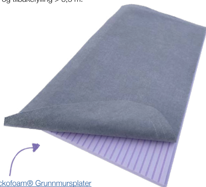
Jackofoam® Grunnmursplater Freste riller på begge sider for god drenering og forbedret lufting av muren.