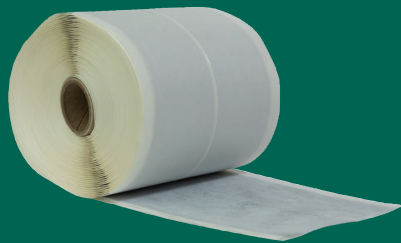
100 mm /10M