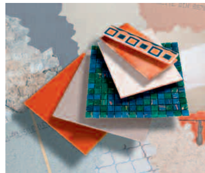
Allsidig bruksområde – for alle underlag og alle keramiske belegg.