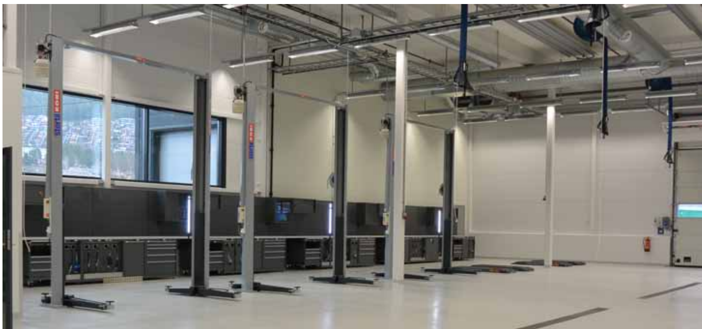
Stertil-Koni SK2030 2-søylere og Lista verkstedinnredning.

Væsker inkludert oljesuger, strøm og luft er integrert i innredningen, og hver mekaniker er utstyrt med en stor, mobil verktøyvogn. For maksimal beskyttelse av PC og skjerm valgte Albjerk Bil å plassere disse i eget overskap.