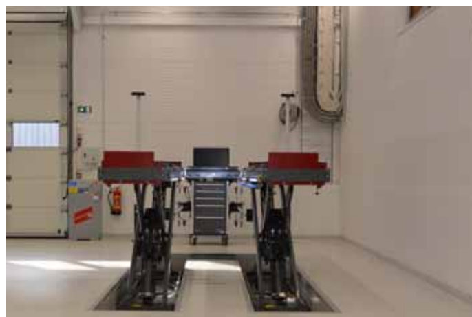
Hjulstillingsplass med VAS 6804 kjørebaneløfter fra MAHA og VAS 701 001 hjulstillingsapparat fra Snap-on.