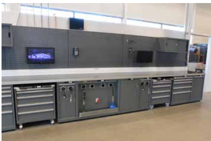
Luft, strøm og væsker er integrert i innredningen.