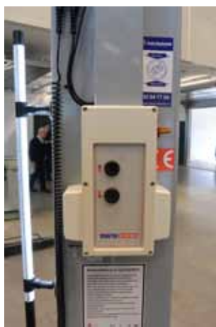
Line Light arbeidslampe med magnetfeste.