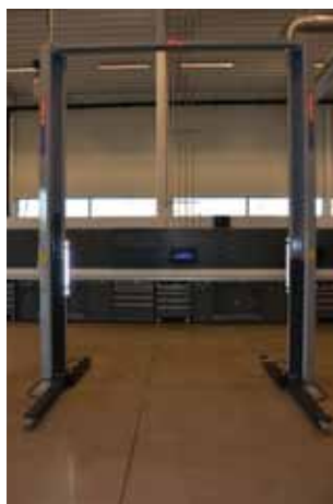
Stertil-Koni SK2030 2-søyler med lys på begge søylene.