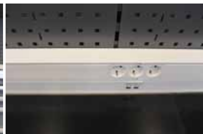
Skinne med stikkontakter og nettverkskontakter er montert på arbeidsbenken.