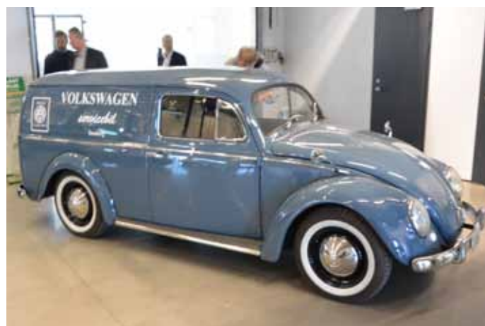
Møller Bil Hortens nye servicebil.