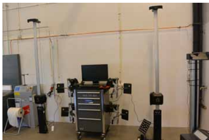
VAS 701 001 hjulstillingsapparat fra John Bean/Snap-on er også godkjent av Volkswagen.