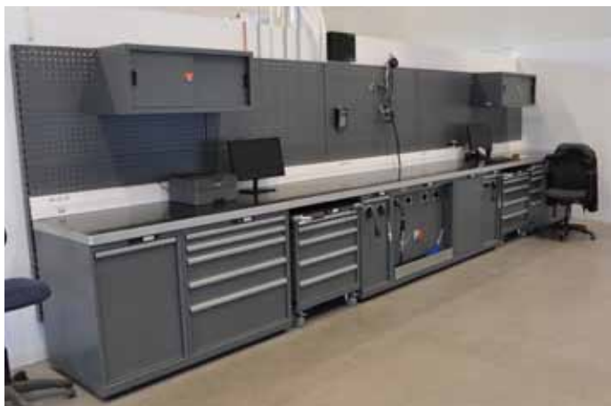
Lækker og robust innredning fra Lista med mye lagringsplass for mekanikeren.