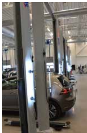
Løfterne er levert med Variquick for svært rask høydetilpasning av løftepads.