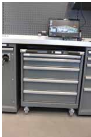
Stor, mobil verktøyvogn.