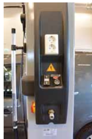
5.5 tonn Rotary 2-søyler for de større varebilene er blant annet utstyrt med trykkluft-uttak på den ene søylen.