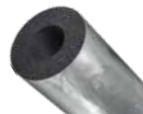
K-FLEX® SRC ECO slanger (Euroclass B L -s1, d0)