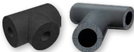
K-FLEX® ST Elastomer T-stykker