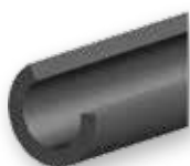
K-FLEX® ST slanger, åpne