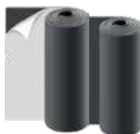
K-FLEX® ST-plater endeløse, med/uten selvklebende belegg