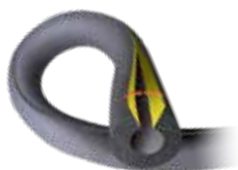
K-FLEX® ST selvklebende slanger