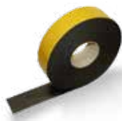
K-FLEX® ST-tape 3 mm