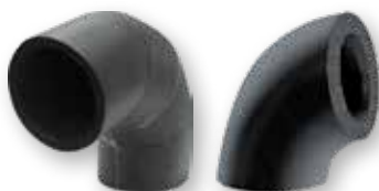
K-FLEX® ST Elastomerbuer