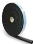
K-FLEX® ST-striper selvklebende i forskjellige isolasjonstykkelser