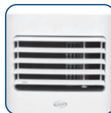
Vertikale justerbare flaps