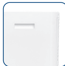
P Praktiske Løftehåntak