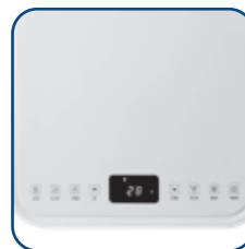
P Touch panel med LED display